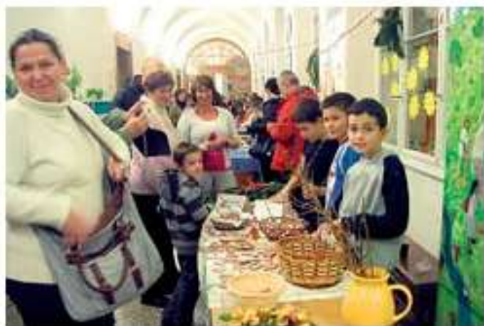
Návštěvníci jarmarků si v obou školách mohli zakoupit typické vánoční produkty